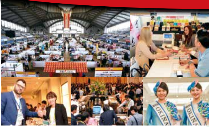
※上の写真はミス沖縄2018

沖 縄大交易会とは、東アジアの中心に位置する沖縄の地位的優位性と沖縄国際物流ハブのネットワークを活用し日本各地の特産品等の販路拡大を目的に開催される「国際食品商談会」です。